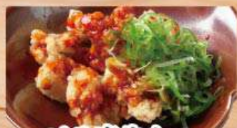
ピリ辛牛もつ 510円 (税込560円)