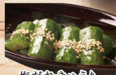
塩だれきゅうり 328円 (税込360円)