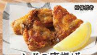
ふぐの唐揚げ 1,073円 (税込1,180円)