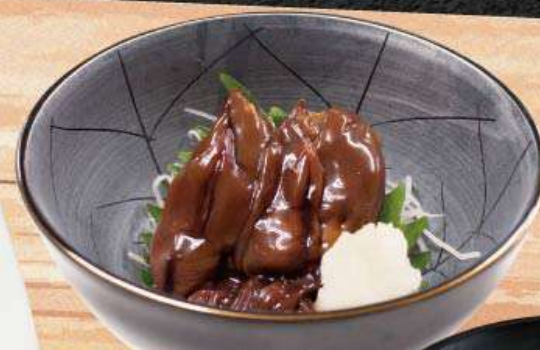
ホタルイカの油漬け 491円 (税込540円)