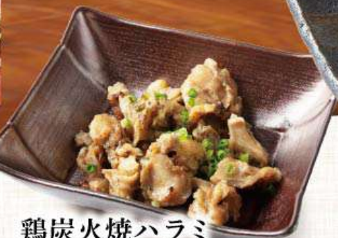
鶏炭火焼ハラミ 537円 (税込590円)