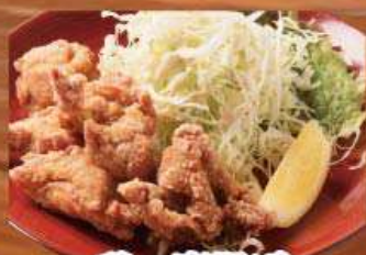
鶏の唐揚げ 591円 (税込650円)