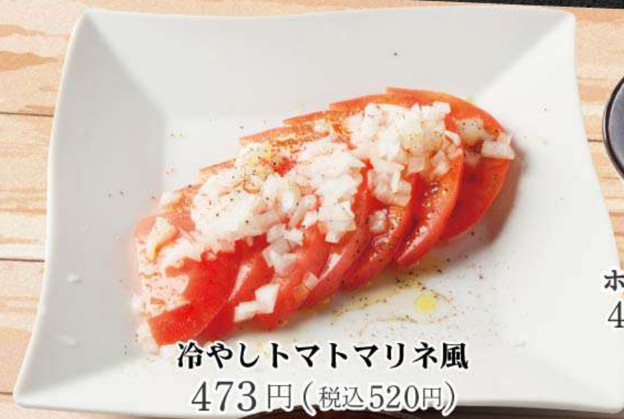
冷やしトマトマリネ風 473円 (税込520円)