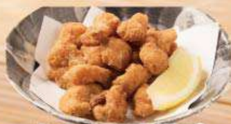
なんこつ唐揚げ 510円 (税込560円)