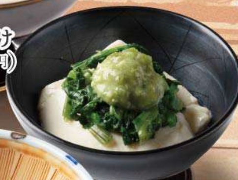
わさび豆腐 410円 (税込450円)