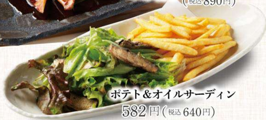
ポテト&オイルサーディン 582円 (税込640円)