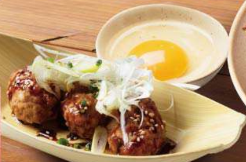
鶏なんこつつくね 生卵付き 582円 (税込640円)