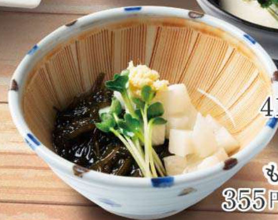
もずく酢 355円 (税込390円)