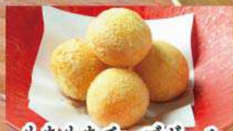
もちもちチーズボール 437円 (税込480円)