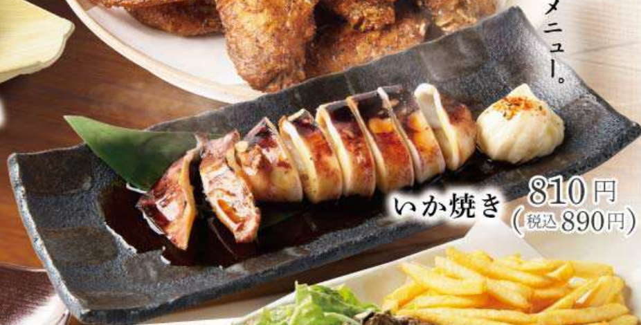
いか焼き 810円 (税込890円)