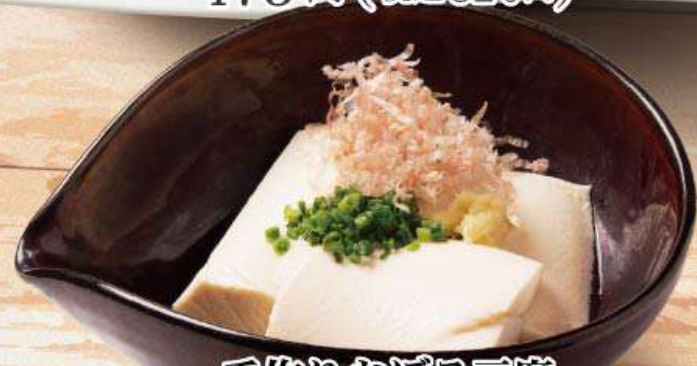
手作りおぼろ豆腐 419円 (税込460円)