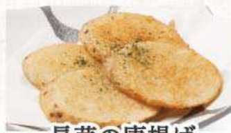
長芋の唐揚げ 346円 (税込380円)