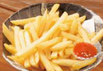
ポテトフライ 337円 (税込370円)