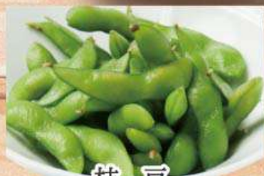
枝豆 291円 (税込320円)