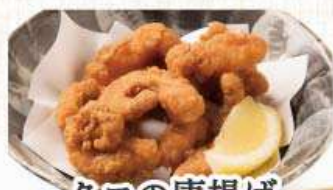
タコの唐揚げ 564円 (税込620円)