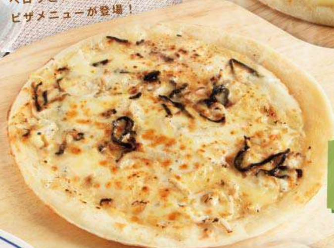
しらすと塩昆布のピザ 873円(税込960円) しらすと塩昆布で磯の香りをプラス！ クセになるオリジナルピザです。