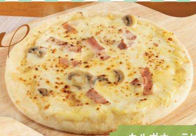
カルボナーラピザ 873円(税込960円) 大人から子どもまで大好きな味の 人気のカルボナーラをピザに！