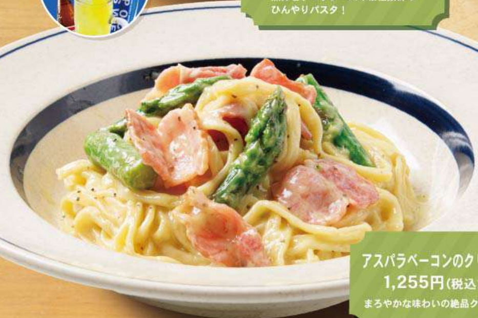
アスパラベーコンのクリームパスタ 1,255円(税込1,380円) まろやかな味わいの絶品クリームパスタ！