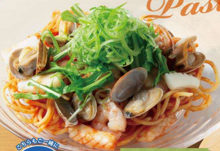
魚介とトマトソースの冷製パスタ 1,164円(税込1,280円) 魚介とトマトソースの相性抜群の ひんやりパスタ！

具材の旨味が満載の パスタメニューと、 ちょうどいいサイズ感で、 ベロリといけちゃう ピザメニューが登場！