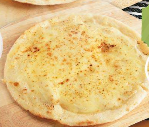
四種のチーズピザ 873円(税込960円) 濃厚なチーズに蜂蜜をかけて食べる、 お子様にも人気のピザメニュー。