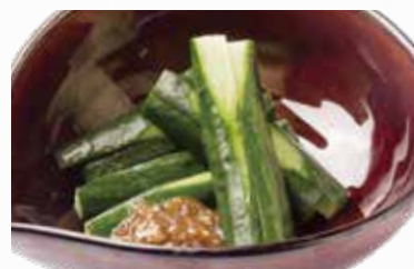
🌀 青唐辛子味噌きゅうり 355円(税込390円)