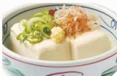
🌀 冷奴 273円(税込300円)