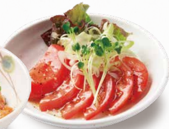
🌀 塩だれトマト 382円(税込420円)