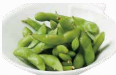
🌀 枝豆 273円(税込300円)