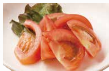
🌀 冷やしトマト 364円(税込400円)