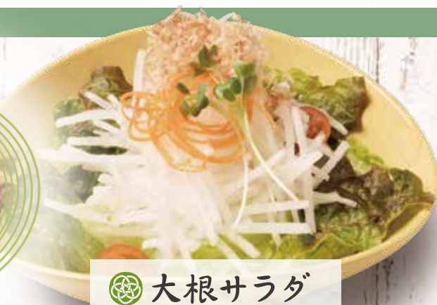
🌀 大根サラダ 491円(税込540円)