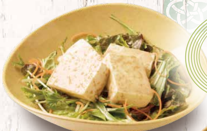
🌀 豆腐サラダ 491円(税込540円)