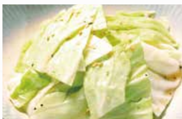
🌀 塩だれキャベツ 355円(税込390円)