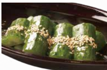
🌀 塩だれきゅうり 355円(税込390円)