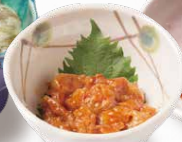
🌀 黄金カレイの えんがわ 364円(税込400円)