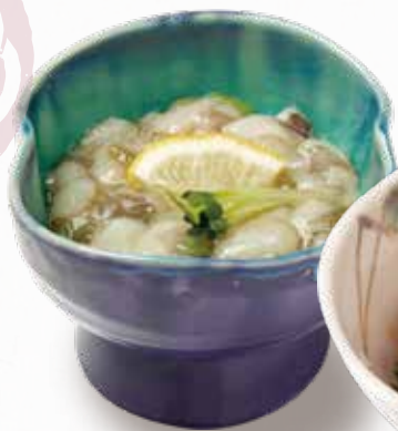
🌀 たこわさび 382円(税込420円)