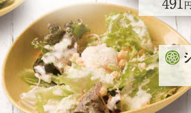
🌀 シーザーサラダ 491円(税込540円)