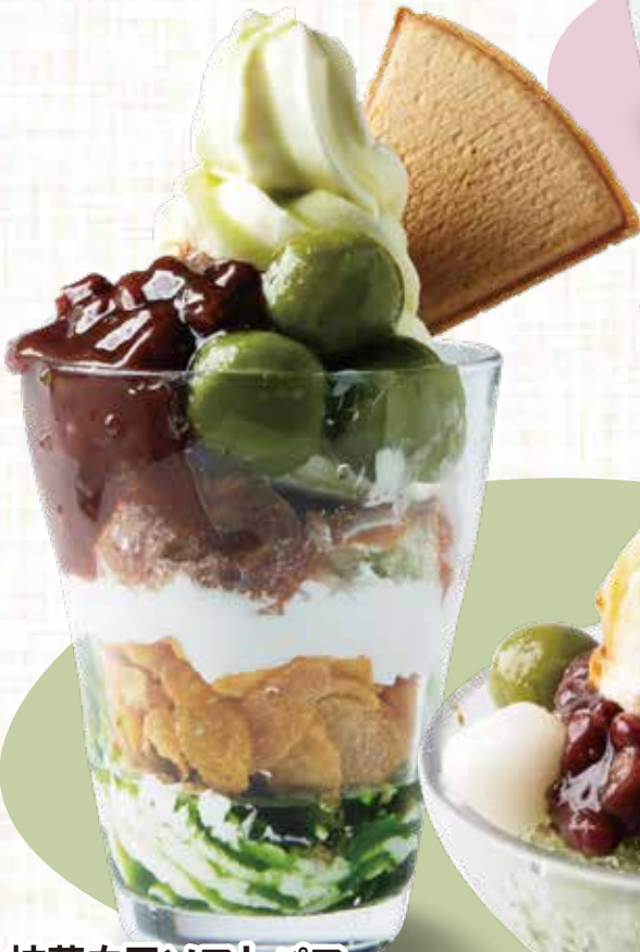
抹茶白玉ソフトパフェ 680円 税込