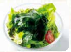
ミニサラダ わかめ 270円 税込