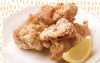
鶏の唐揚げ 3個 400円税込