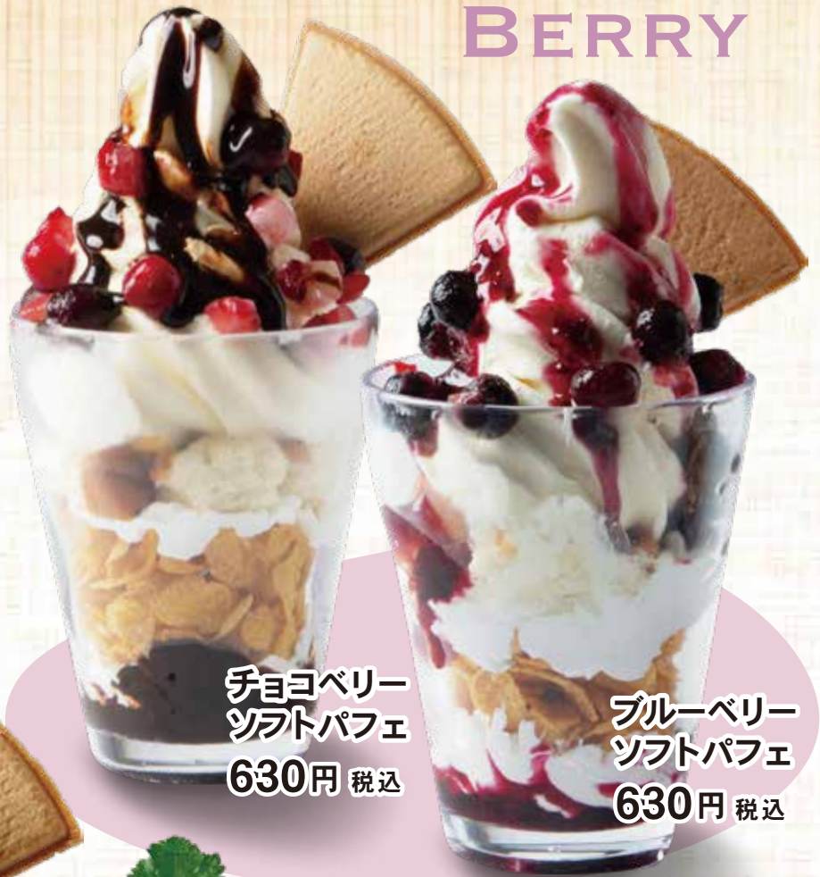
チョコベリー ソフトパフェ 630円 税込