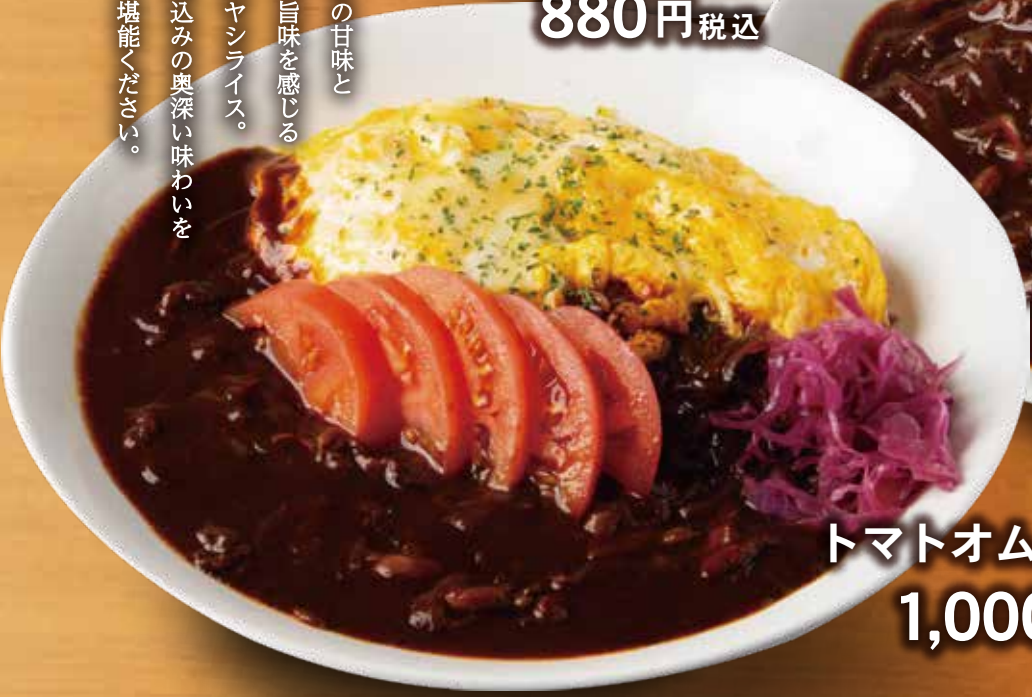
トマトオムハヤシライス 1,000円 税込

玉ねぎの甘味と牛肉の旨味を感じる絶品ハヤシライス。店内仕込みの奥深い味わいをぜひ堪能ください。