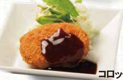
コロッケ 1個 230円税込