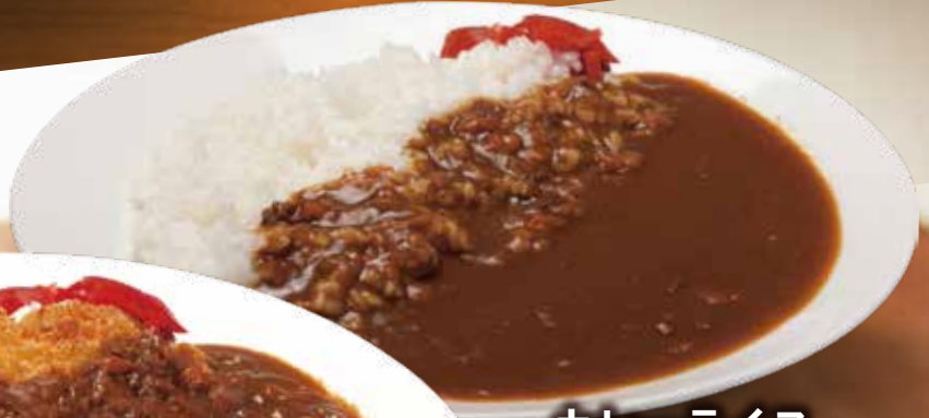
カレーライス 700円 税込

玉ねぎの甘味と牛肉の旨味を感じる絶品ハヤシライス。店内仕込みの奥深い味わいをぜひ堪能ください。