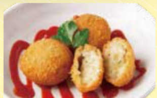
チーズリゾットコロッケ 430円 税込