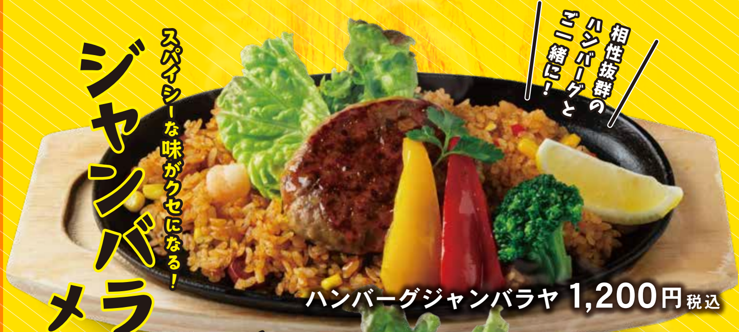
ハンバーグジャンバラヤ 1,200円 税込