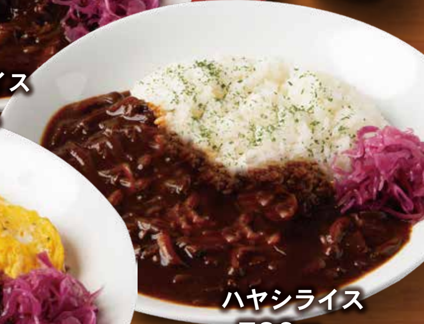
ハヤシライス 780円 税込