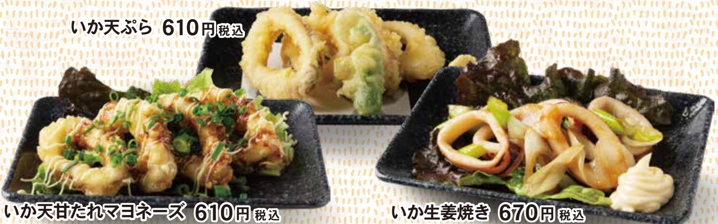
いか天甘たれマヨネーズ 610円税込