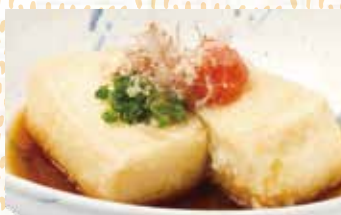
揚げ出し豆腐 420円税込