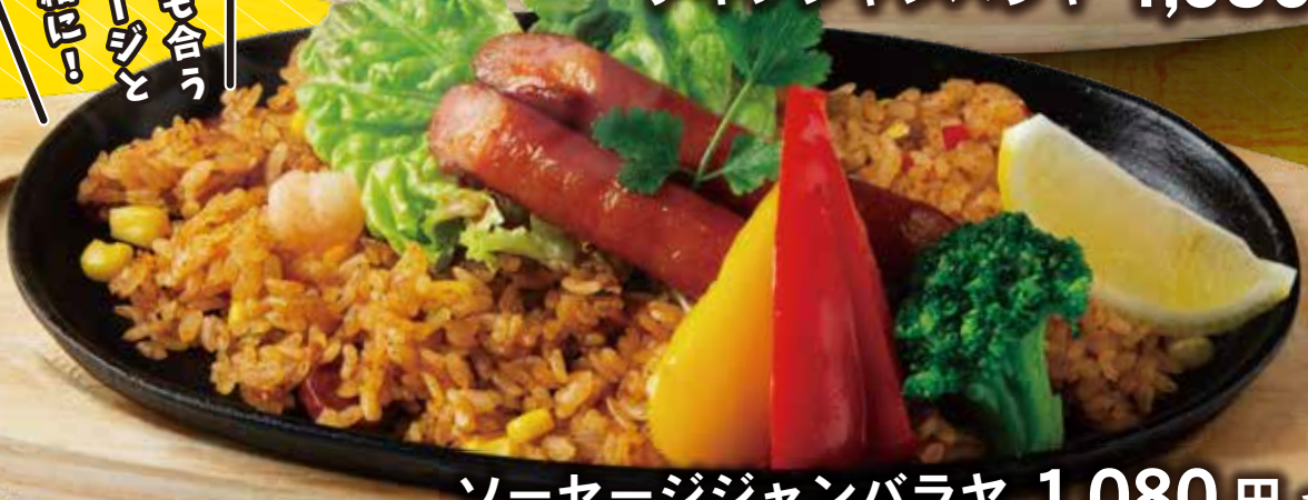
ソーセージジャンバラヤ 1,080円 税込