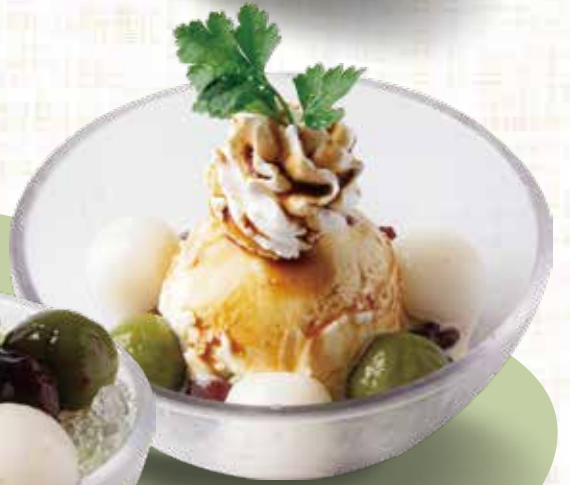
抹茶白玉あずき 480円 税込