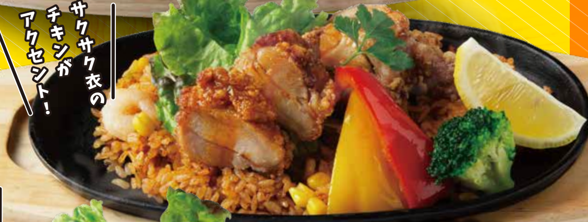
チキンジャンバラヤ 1,080円 税込