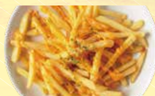
チーズポテト 430円 税込