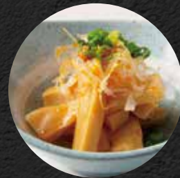
メンマねぎラー油 450円 税込