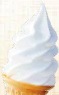
Soft Cream ソフトクリーム 各種 税込 350円