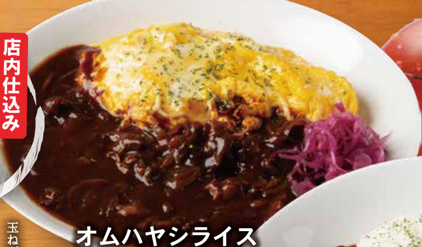
オムハヤシライス 880円 税込