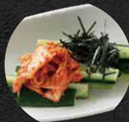
キムチきゅうり 450円 税込