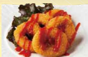
チーズリングフライ 550円 税込