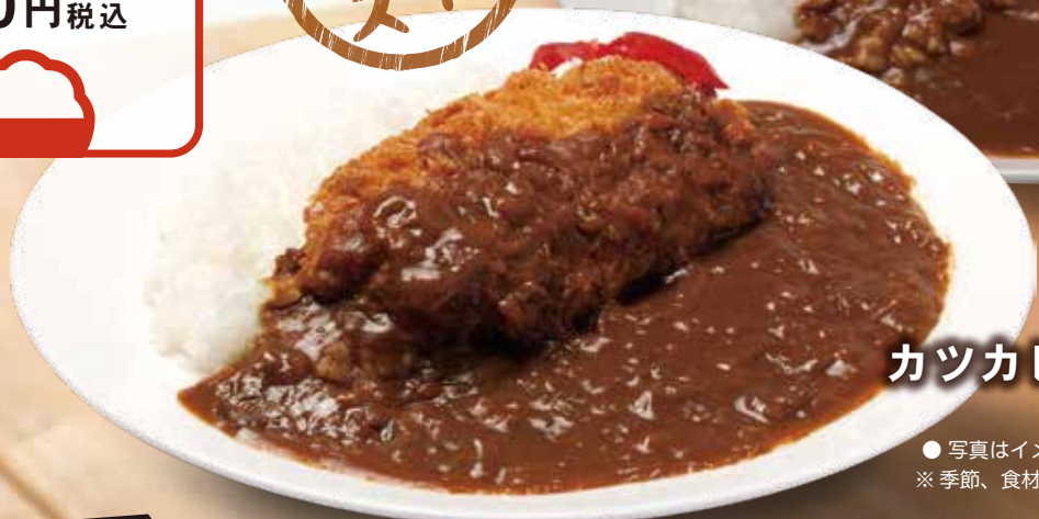
カツカレー 920円 税込