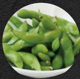
枝豆 310円 税込