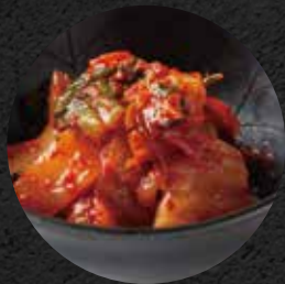
白菜キムチ 350円 税込