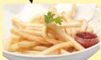
ポテトフライ 350円 税込