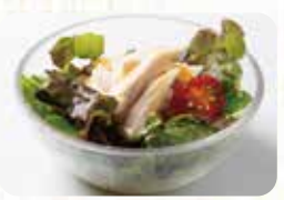
ミニサラダ チキン 300円 税込