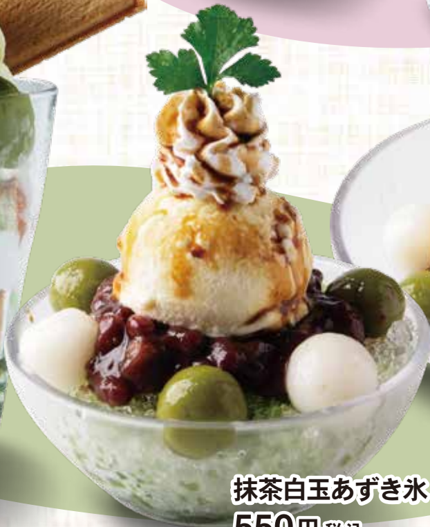
抹茶白玉あずき氷 550円 税込