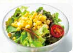
ミニサラダ コーン 270円 税込