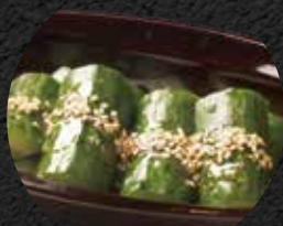
塩だれきゅうり 380円 税込