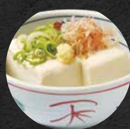
冷奴 310円 税込