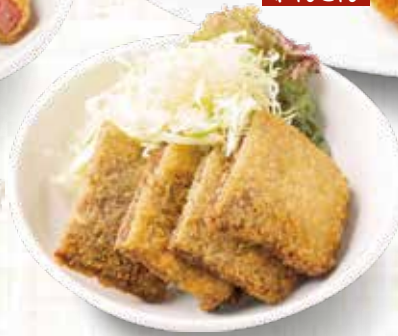
レバーカツ 550円税込