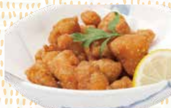
なんこつ唐揚げ 450円税込