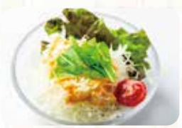
ミニサラダ キャベツ 250円 税込