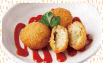
チーズリゾット コロッケ 430円税込