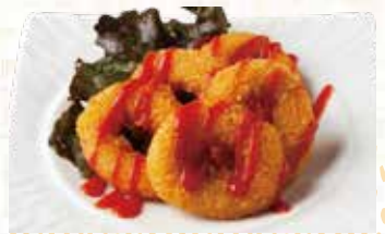
チーズリングフライ 550円税込