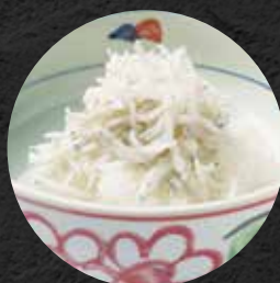
しらすおろし 310円 税込