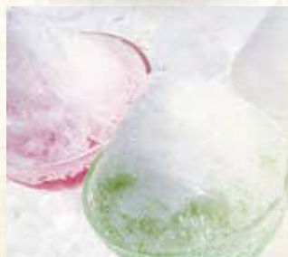
Shaved Ice かき氷 [シロップかけ放題] 税込 300円