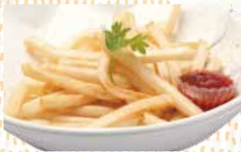
ポテトフライ 350円税込