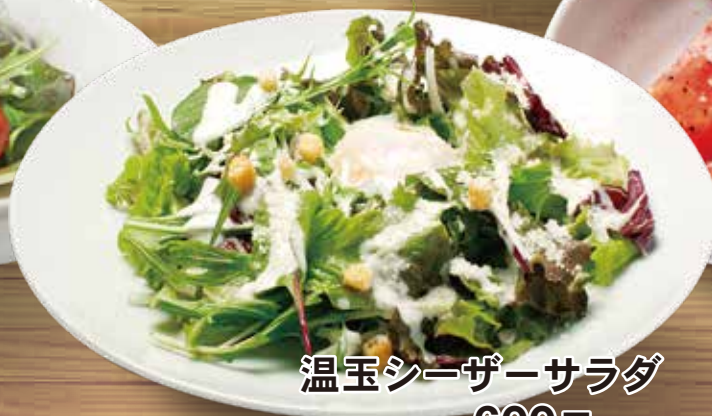
温玉シーザーサラダ 600円 税込