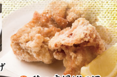
鶏の唐揚げ3個 364円(税込400円)