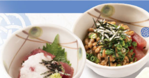
◎ まぐろ山かけ 437円 (税込480円)

海の香りを感じる 当店おすすめの魚メニュー。 メイン料理に もう一品いかがでしょうか？