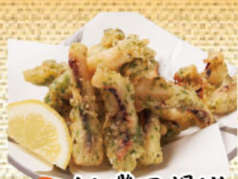
イカ磯辺揚げ 437円(税込480円)