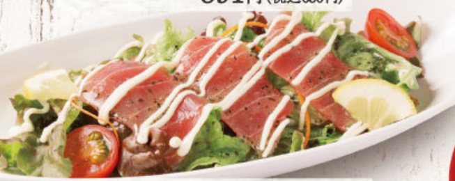
◎ まぐろのカルパッチョ 591円 (税込650円)