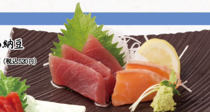
◎ お造り二種盛り 610円 (税込670円)