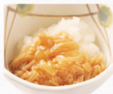
◎ なめ茸おろし 319円 (税込350円)