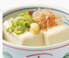
◎ 冷奴 291円 (税込320円)