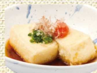
揚げ出し豆腐 410円(税込450円)