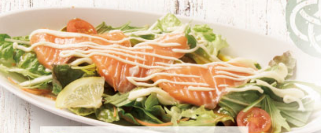
◎ サーモンのカルパッチョ 591円 (税込650円)