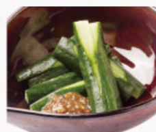
◎ 青唐辛子味噌きゅうり 391円 (税込430円)