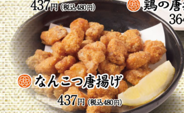
なんこつ唐揚げ 437円(税込480円)