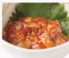
◎ たこキムチ 391円 (税込430円)