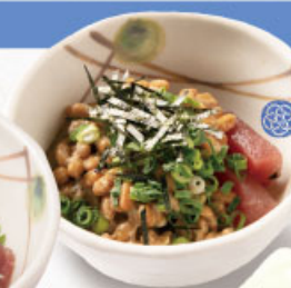
◎ まぐろ納豆 473円 (税込520円)