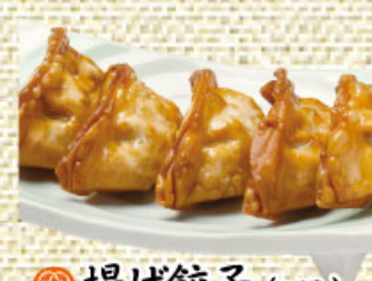
揚げ餃子(5個) 410円(税込450円)