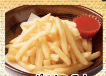
ポテトフライ 346円(税込380円)