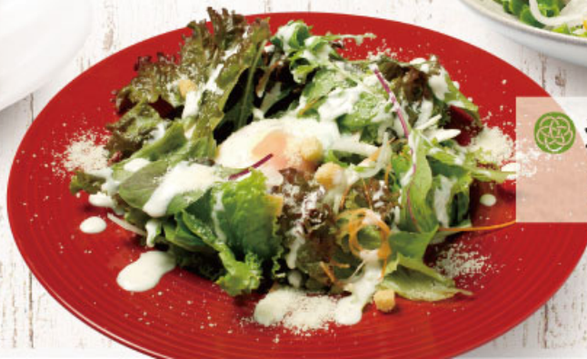
◎ シーザーサラダ 537円 (税込590円)