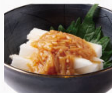
◎ 長芋なめ茸 410円 (税込450円)