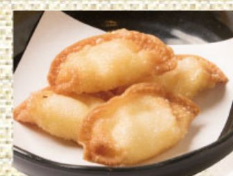
おつまみチーズ揚げ 437円(税込480円)