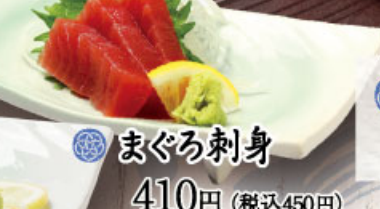
◎ まぐろ刺身 410円 (税込450円)