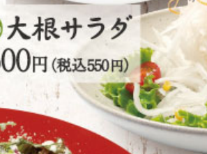
◎ 大根サラダ 500円 (税込550円)