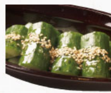
◎ 塩だれきゅうり 391円 (税込430円)