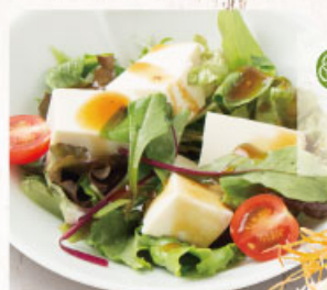
◎ 豆腐サラダ 410円 (税込450円)