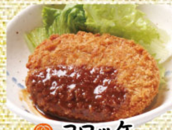
コロッケ 200円(税込220円)