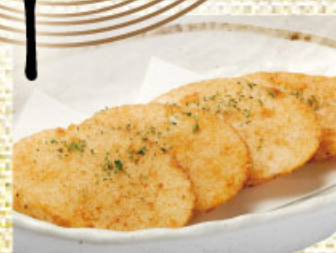
長芋唐揚げ 410円(税込450円)