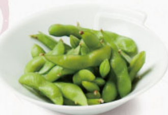
◎ 枝豆 291円 (税込320円)