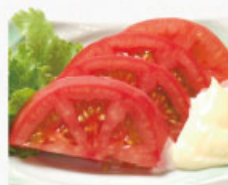
◎ 冷やしトマト 391円 (税込430円)