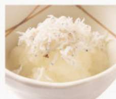
◎ しらすおろし 319円 (税込350円)